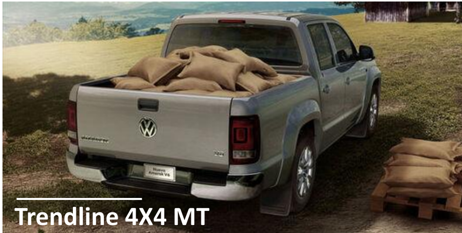
Trendline 4X4 MT