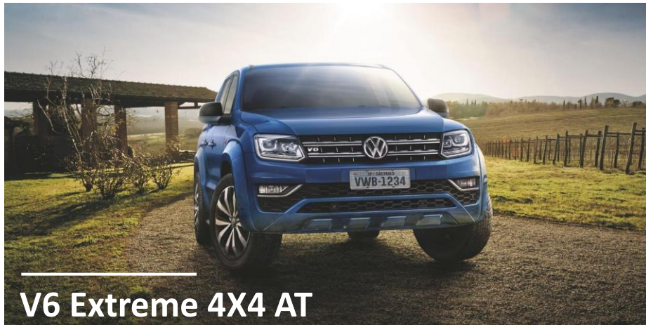
V6 Extreme 4X4 AT