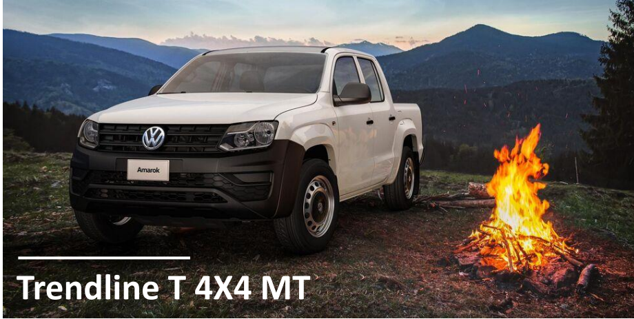
Trendline T 4X4 MT