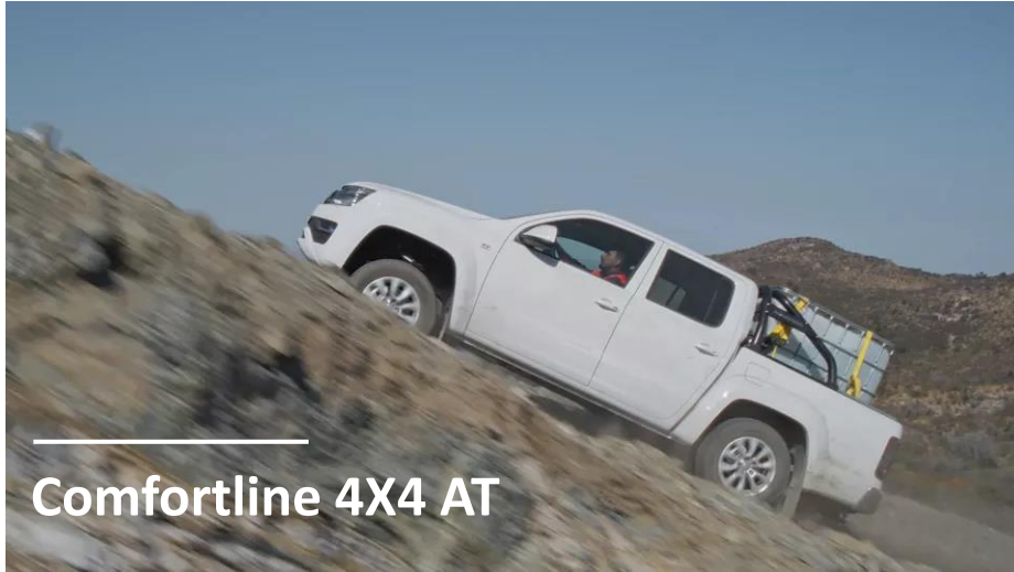
Comfortline 4X4 AT